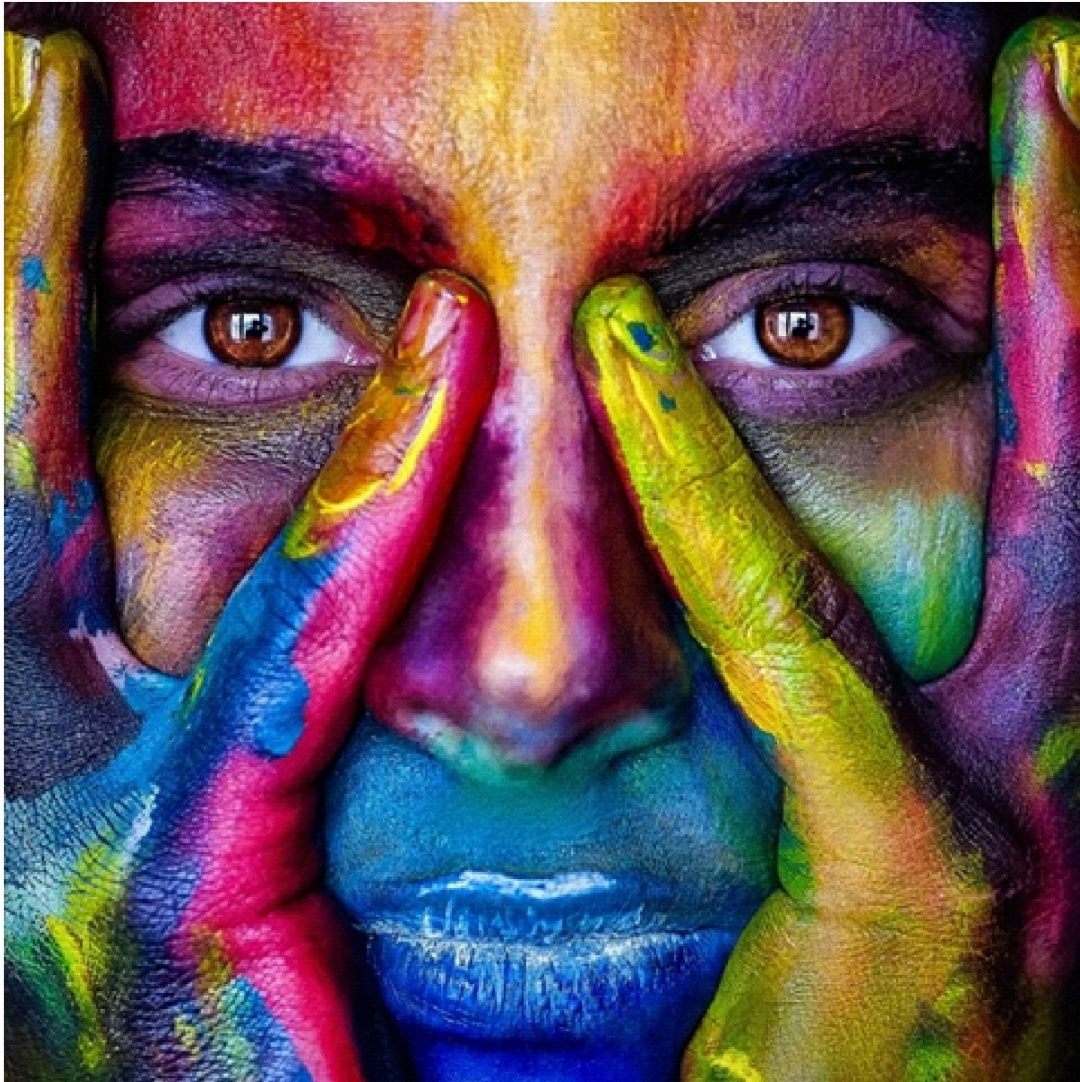
Imagen: www. Porcel.legal . El derecho del Arte.

CREAR...Crear...Crear, no conformarse al qué dirán, no conformarse a una visión estancada donde la mayoría de la gente busca seguridad, donde les da miedo intentar algo nuevo, no conformarse a dar un paso en falso por el miedo de no saber qué pasará, el miedo es el mayor enemigo del éxito, tal vez costará trabajo subir y llegar a realizar el sueño con el que se ha comenzado, pero la parte que nos corresponde es perseverar.